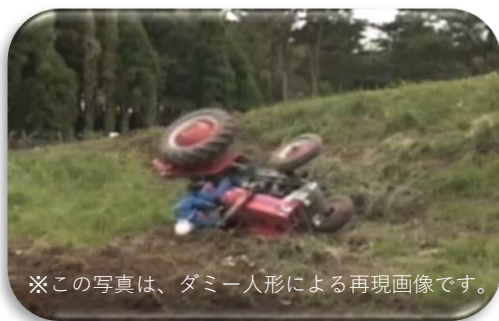
※この写真は、ダミー人形による再現画像です。