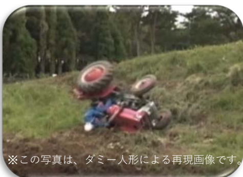
※この写真は、ダミー人形による再現画像です。