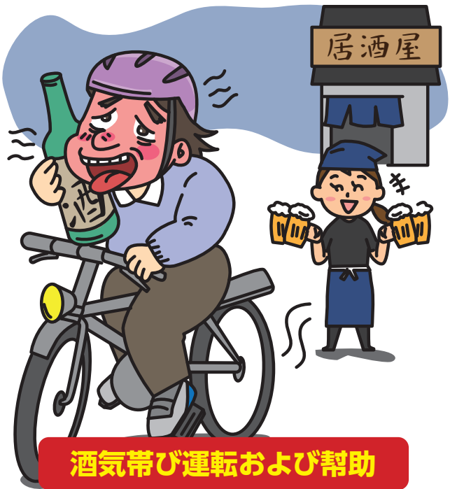
酒気帯び運転および帮助

2024年11月1日 改正道路交通法の施行 自転車の危険な運転に新しく下記罰則が整備