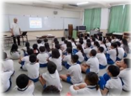
広報啓発活動 (非行防止教室)