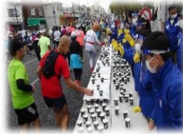
立ち直り 支援活動