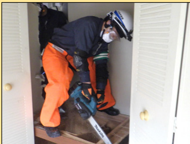
障害物（床）破壊訓練