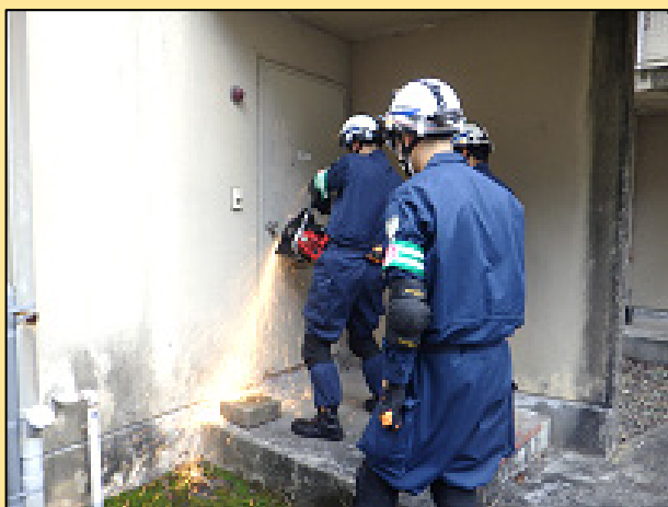
障害物（ドア）破壊訓練

実施日 令和6年1月23日（火） 実施場所 兵庫県姫路市 旧兵庫県立姫路循環器病センター 実施所属 飾磨警察署、姫路警察署、災害対策課