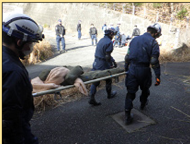
要救助者搬送訓練

飾磨警察署及び姫路警察署は、災害対処能力の向上を図るため、兵庫県立はりま姫路総合医療センターの協力により、解体予定の旧兵庫県立姫路循環器病センターにおいて地震災害を想定した救出救助訓練を実施しました。