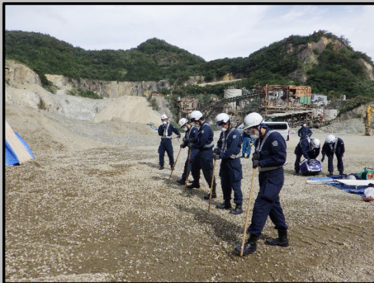
警杖による搜索活動