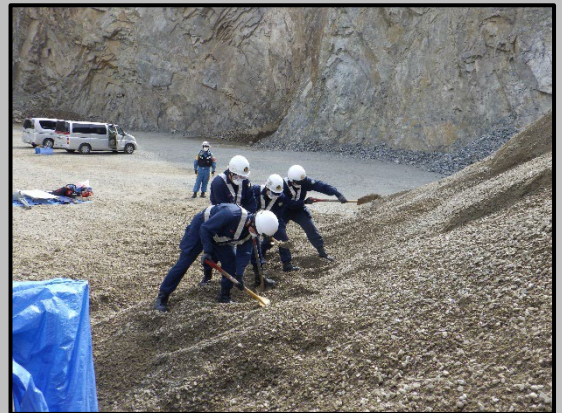
土砂埋没家屋の掘り起こし