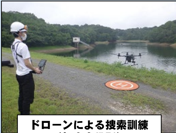
ドローンによる捜索訓練 (加東市役所)

実施日時 令和4年7月14日(木) 午前10時から午後0時までの間 実施場所 兵庫県加東市 安政池 実施所属 加東警察署、小野警察署、災害対策課 参加機関 加東市役所(防災課)