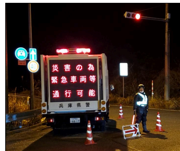
夜間のインターチェンジにおける活動