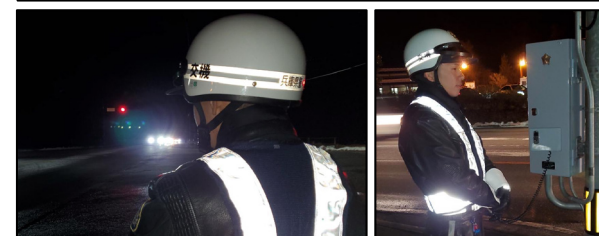
夜間の交差点における活動