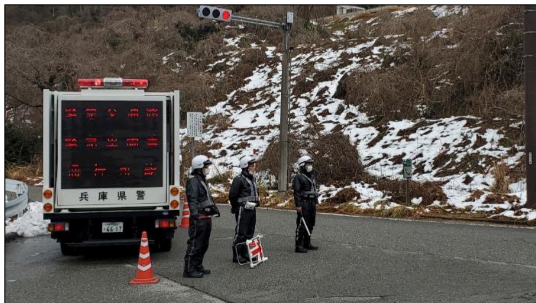
「上棚矢駄インターチェンジ」における活動