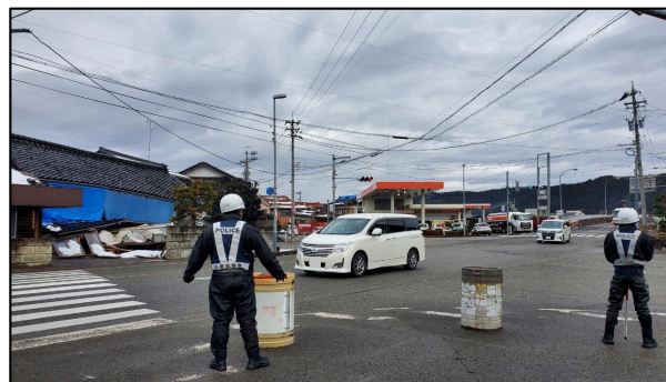
「浜田南交差点」における活動