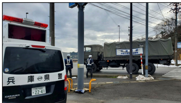
「大津交差点」における活動