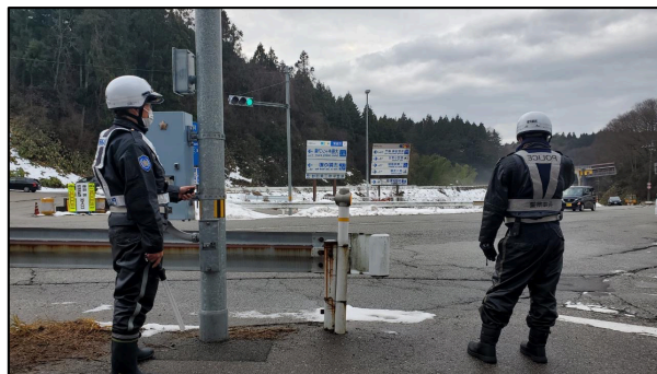
「徳田大津インター交差点」における活動