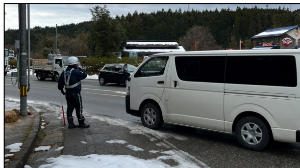
「ツインブリッジのと口交差点」における活動