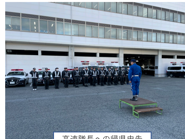
高速隊長への帰県申告