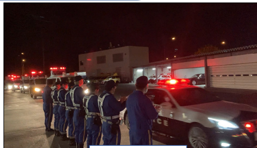
同僚に見送られ出発