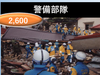
被災者の救出救助