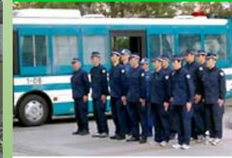
身元確認の資料収集