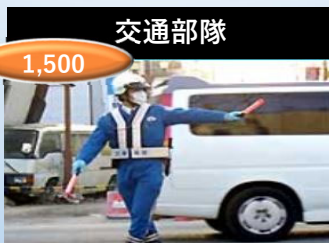
緊急交通路の確保