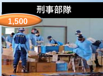
検視・身元確認等