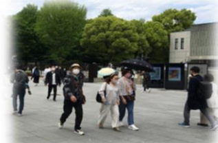
■ みまもりカメラ映像 = 横（目線）からの視点