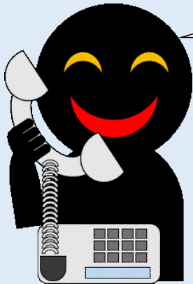
警察官をかたる犯人