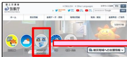
危険度分布 (キキクル)