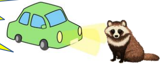
過去4年間の野生動物との物件交通事故発生件数(加東署管内)