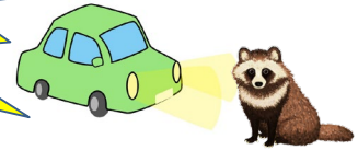
令和3年から令和5年までの野生動物との月別物件交通事故発生件数