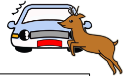
令和元年から令和3年までの野生動物との月別物件交通事故発生件数