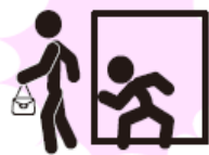
チカン・わいせつ事件