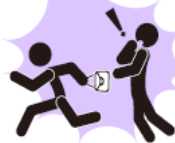
ひったくり・路上強盗