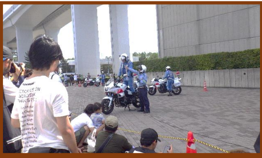
ライダーズスクール

令和5年度は、官公庁、企業、病院、老人クラブ等さまざまな業種・団体への交通安全教室・講習会を行いました。