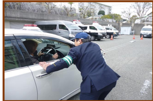
ドライバースクール