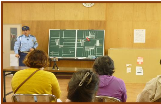
警察官による交通安全講話