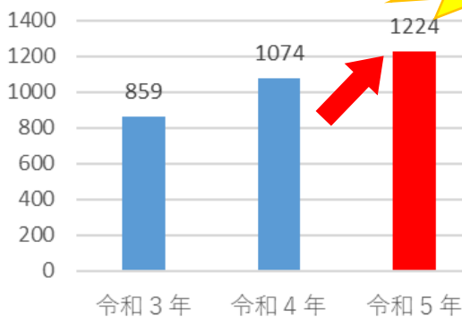
【特殊詐欺認知件数】

令和5年中、兵庫県では特殊詐欺被害が 1224件 、被害額が約 19億9000万円 と増加傾向!